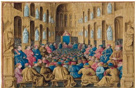
Illuminura do Livre des Passages d'Outre-mer