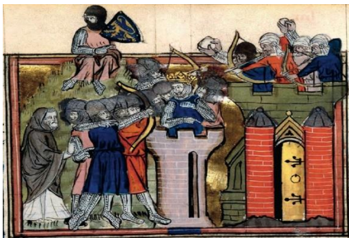
Illuminura das Crônicas de Guillaume de Tyr