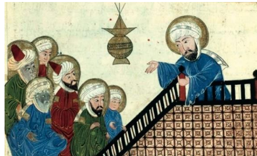
Illuminura de um manuscrito otomano