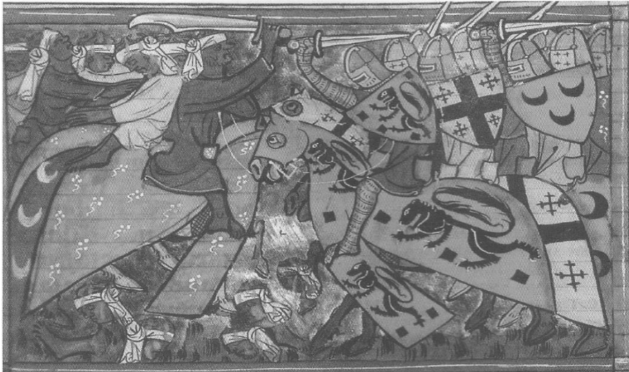
Doc. 2 Carta do Rei de Inglaterra, Ricardo Coração de Leão