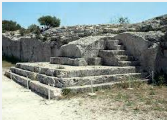
Vista da Pnix, com os degraus que davam acesso à plataforma onde os cidadãos discursavam. Na Eclésia, os cidadãos debatiam e votavam assuntos importantes.

Tucidides, História da Guerra do Peloponeso , II, XXXVII, XL, XLI.