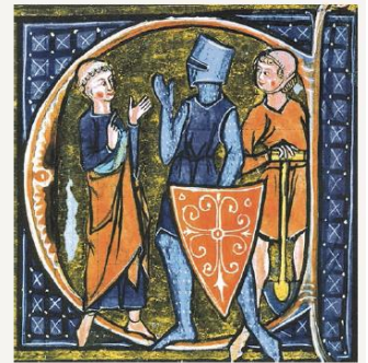
A sociedade medieval.

1. Explícite dois aspetos que evidenciam a presença do Cristianismo na vida das populações do Ocidente medieval.