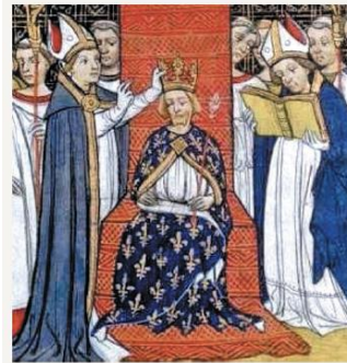
A coroação dos reis.