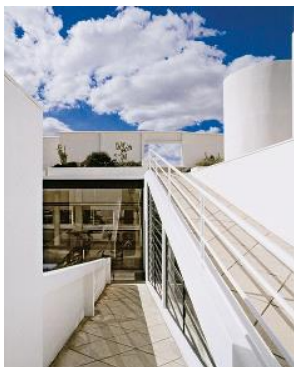
Arquitetura funcional (Villa Savoy, Le Corbusier, Poissy, França, 1927)