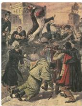
O Regicídio, 1908