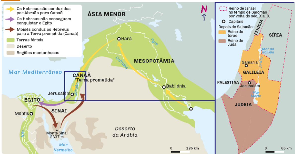
A Palestina no 1º milénio a. C. e as deslocções dos Hebreus