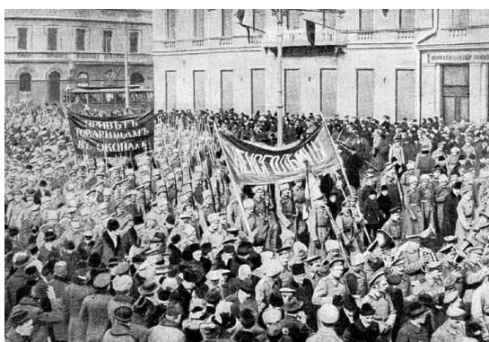
C. Revolução de Outubro, Rússia D.