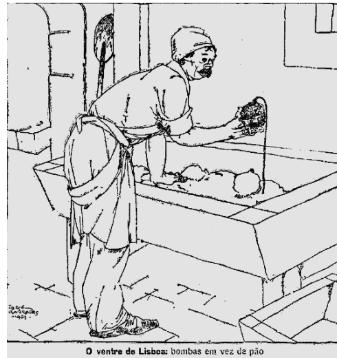
O ventre de Lisboa: bombas em vez de pão