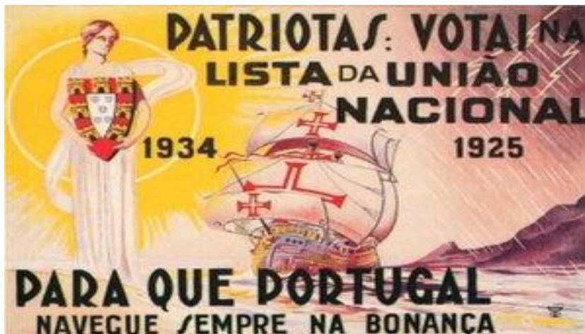
Cartaz de propaganda do Estado Novo, 1934.