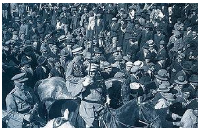
B – Desfile triunfal das forças comandadas pelo general Gomes da Costa em 28 de maio de 1926