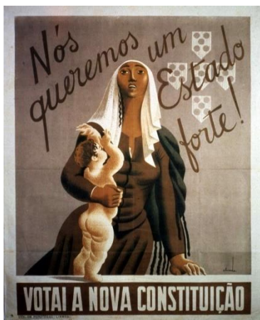
A – Aprovação da Constituição do Estado Novo em 1933