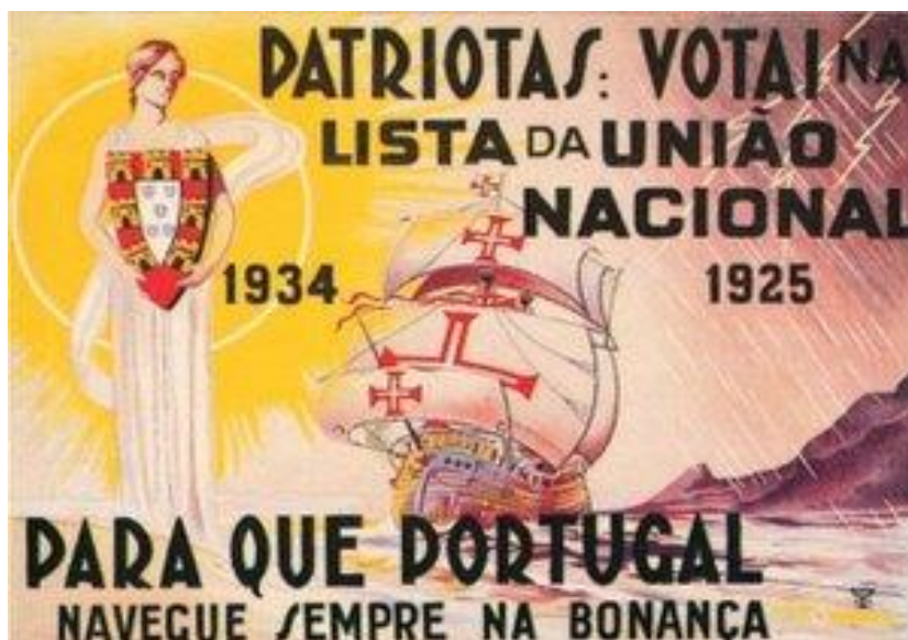
Cartaz de propaganda do Estado Novo, 1934

DOC. 1 - DA CRISE DA PRIMEIRA REPÚBLICA AO ESTADO NOVO