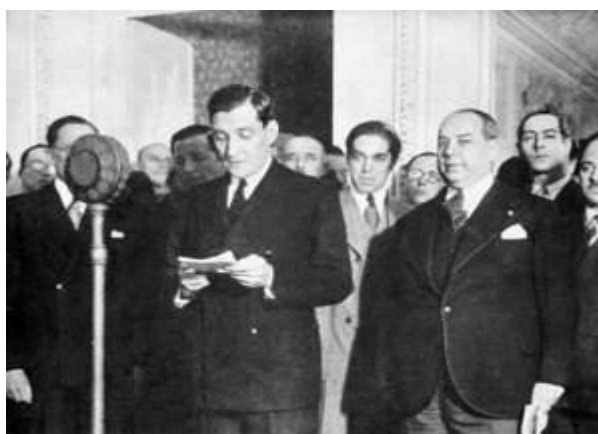
D – Salazar toma posse como Ministro das Finanças.