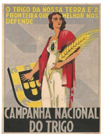
C – Início da Campanha do Trigo (1929-1937)