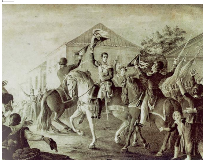
D. Miguel e a Vila-Francada, gravura de M. Sendim.