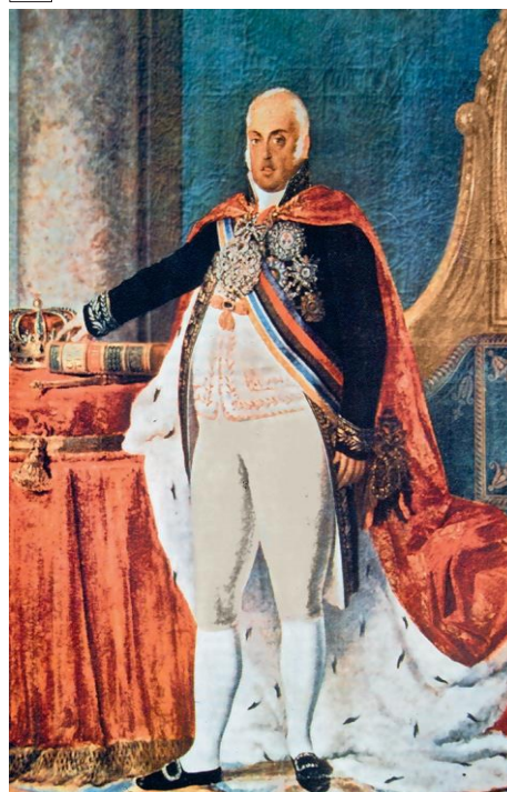
Juramento da Constituição por D. João VI, pintura de Domingos António Sequeira.