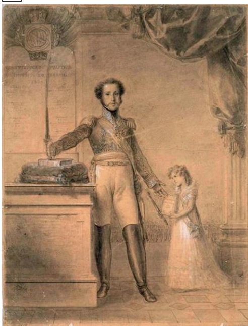
Juramento da Carta Constitucional por D. Pedro IV, desenho de Domingos António Sequeira.