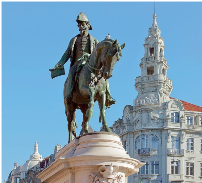
Monumento comemorativo na Praça da Liberdade, no Porto, da autoria do escultor francês Célestin-Anatole Calmels