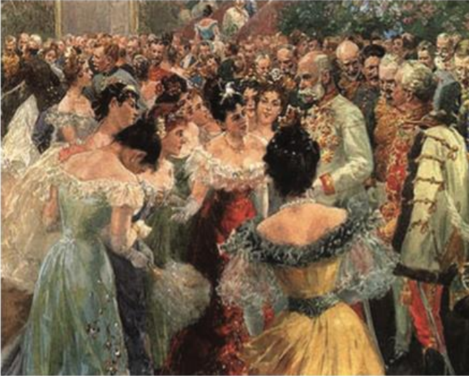
A. Baile em Viena (Áustria), cerca de 1900, obra de Wilhelm Gause. O imperador Francisco José junto de várias senhoras no baile da Corte, para o qual eram convidados cerca de 2000 representantes da elite aristocrática, política e eclesiástica. Este baile abria a temporada da sociedade da corte. O momento alto do evento era o círculo, quando alguns dos presentes conseguiam trocar palavras com as majestades imperiais.