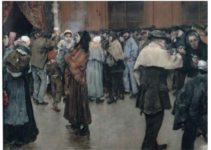
B. A sopa da manhã, obra de Norbert Goeneutte, datada de 1880. Cerca de 1840, um terço da população francesa era apoiada pela caridade pública, que, para além de ser um meio de auxílio aos pobres, também os mantinha num sistema de sujeição paternalista. A cena de caridade, pintada de forma naturalista, retrata a pobreza urbana.