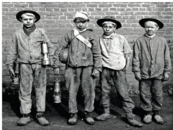
Os aprendizes. Na imagem, datada de 1910, jovens rapazes preparam-se para descer para as galerias das minas, que eram demasiado estreitas para os adultos.