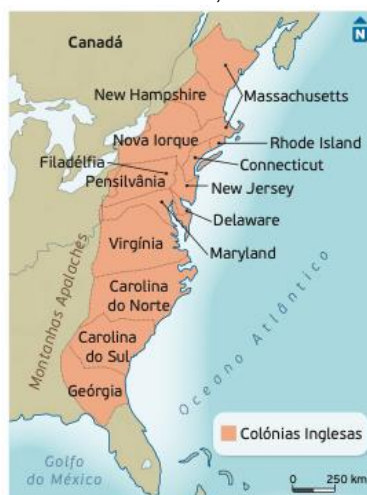
DOC. 1 | AS COLÓNIAS INGLESAS DA AMÉRICA DO NORTE, CERCA DE 1745

A. Os Ingleses, nos séculos XVII e XVIII, fundaram na costa atlântica da América do Norte ... a ..., que foram integradas na Coroa britânica. Em 1783, essas colónias uniram-se para lutar e obter a independência. A ... b ..., que opôs a Inglaterra e a França, resultou na perda da maior parte dos territórios coloniais franceses na América e garantiu a supremacia inglesa. O governo de Londres quis que as colónias assumissem os ... c ... do conflito. Os colonos ficaram indignados com a exigência de ... d ... feita pelo Parlamento sem lhes ter sido pedido o seu consentimento.