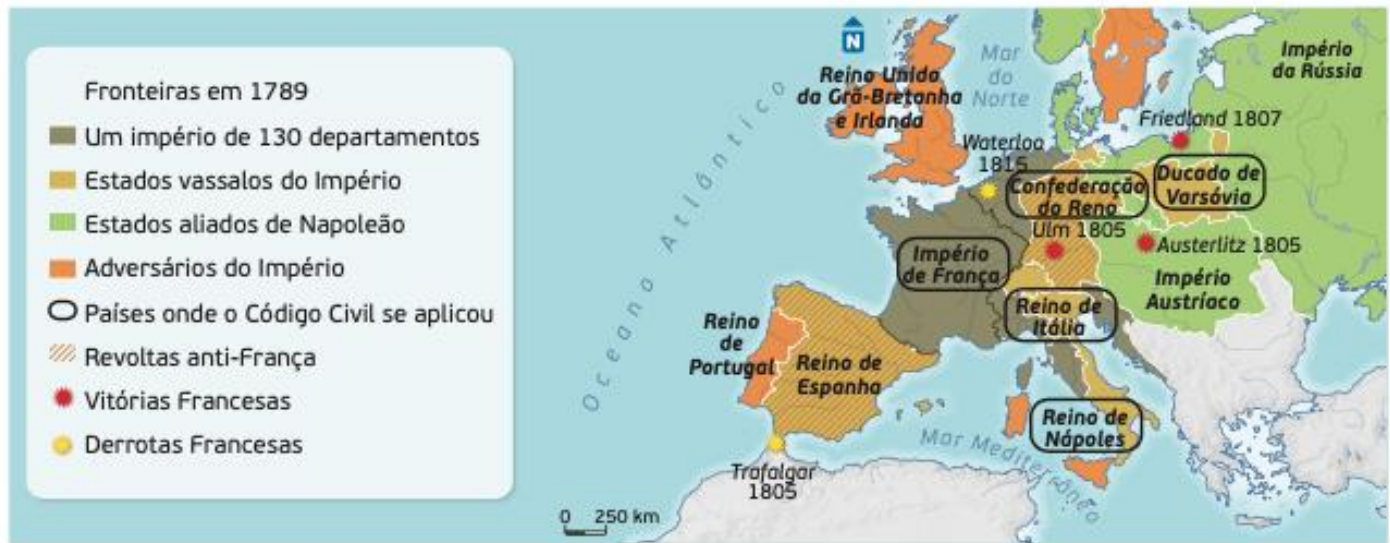
DOC.5 A SITUAÇÃO POLÍTICA DA EUROPA (1789 A 1815)

7. O início do Consulado foi concretizado por um golpe militar liderado por... 5 Pontos