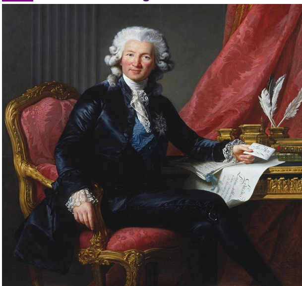
Charles Alexandre, visconde de Calonne, advogado que se tornou Ministro das Finanças do rei Luís XVI, em 1783 (Retrato de Élisabeth-Louise Vigée Le Brun , 1784)