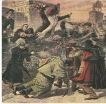
O Regicídio, 1908