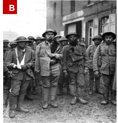
Soldados portugueses feitos prisioneiros por forças alemãs