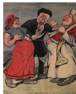
Documento 6 – Caricatura da publicação O Século, que representa a Lei da Separação da Igreja e do Estado

3.1. Menciona quatro medidas tomadas pelos governos da I República no âmbito da laicização e da educação. 4%