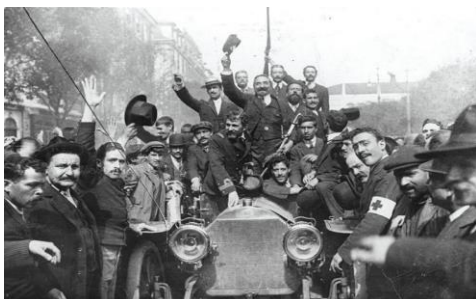
Documento 4 – A proclamação da República

Lisboa amanheceu hoje ao som do troar da artilharia. Proclamada por importantes forças do exército, por toda a armada e auxiliada pelos populares, a República tem hoje o seu primeiro dia de História. [...] O povo está verdadeiramente louco de satisfação. Pode dizer-se que toda a população de Lisboa está na rua vitoriando a República.