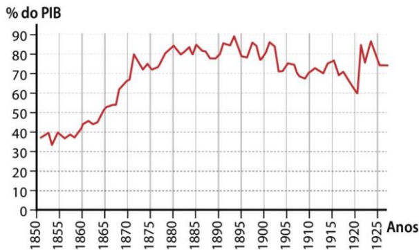
Documento 1 - A dívida pública portuguesa entre 1850 e 1925