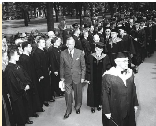
A chegada de George Marshall à Universidade de Harvard, onde fez o seu discurso

G. Marshall, discurso proferido na Universidade de Harvard, 5 junho 1947