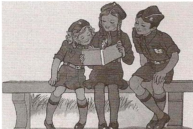
Ilustração do livro da 1ª classe representando elementos da mocidade portuguesa