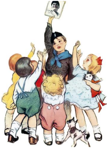
B Capa do livro infantil Duce Nostro , 1933 (pormenor).