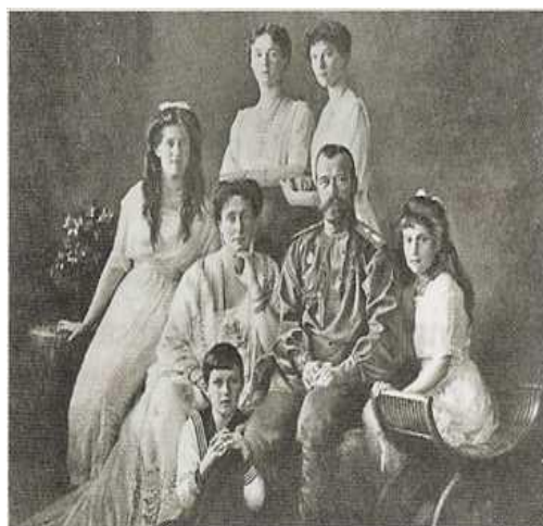
Doc.2 – Família Imperial Russa no início do séc. XX

1. Carateriza o ambiente vivido na Rússia nas vésperas da Revolução de Fevereiro de 1917. 6%