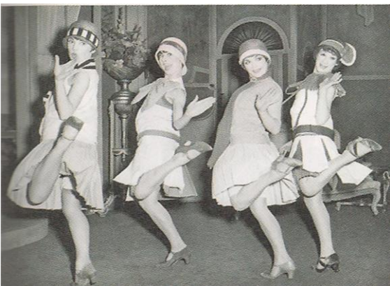
As danças e a moda