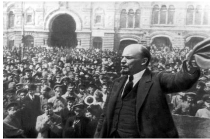
Lenine discursando perante a multidão