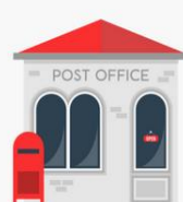
LA OFICINA DE CORREOS