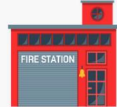
LA ESTACIÓN DE BOMBEROS